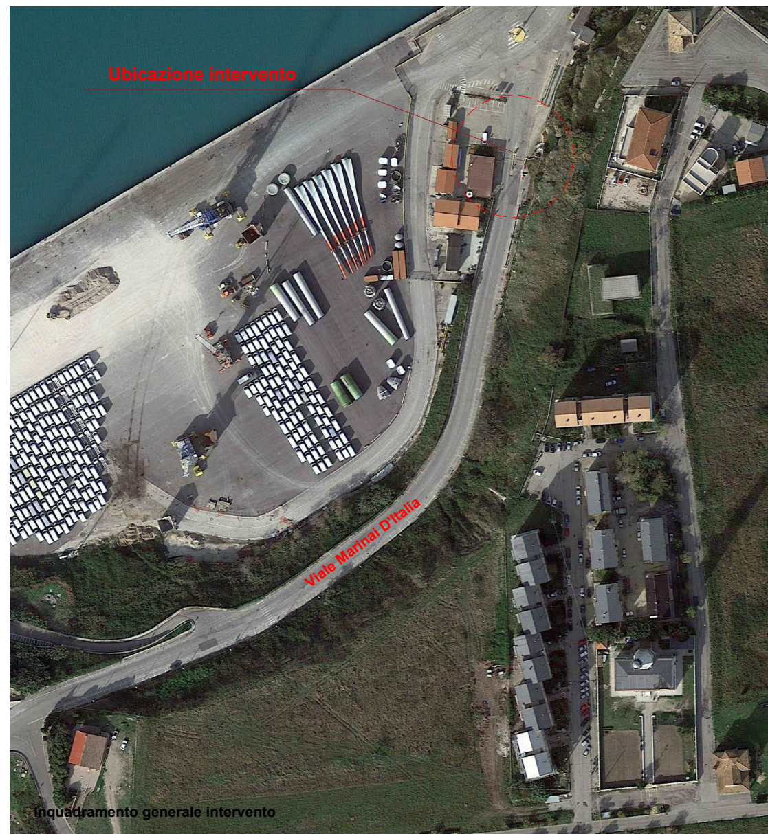
Inquadramento generale intervento